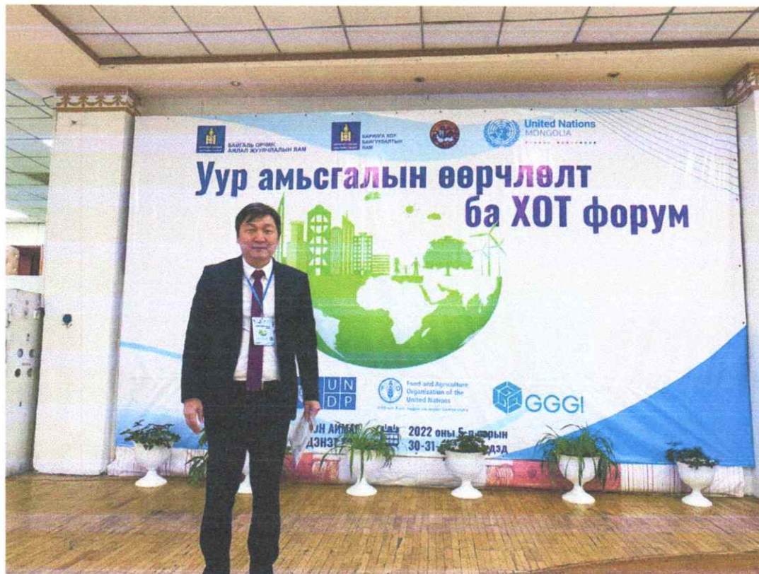
Зураг 4: Уур амьсгалын өөрчлөлт ба ХОТ форум

2022 оны 05 дугаар сарын 30, 31-нд Орхон аймагт зохион байгуулагдсан “Уур амьсгалын өөрчлөлт ба Хот” форумын ногоон санхүүжилтийн хэлэлцүүлэгт оролцож, илтгэл танилцуулав.